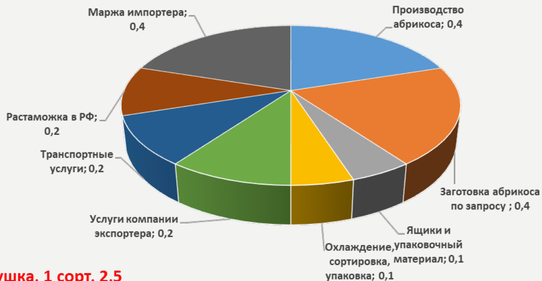
Стоимость добавления ценности, сушка, 1 сорт, 2,5 долл.