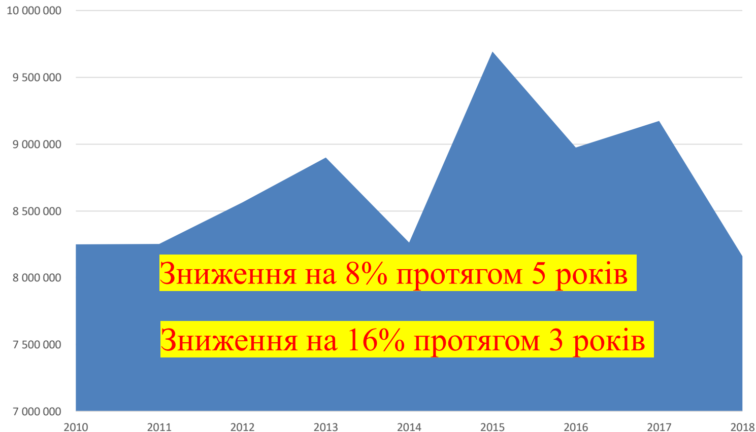
Обсяги світового імпоту яблук, тонн